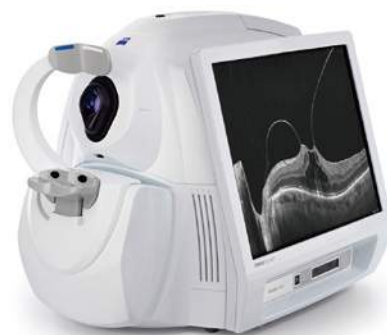
光干渉断層計 シラスHD-OCT5000 (CARL ZEISS MEDITEC社製)

特に黄斑疾患や緑内障の早期発見と、治療を開始してからの極微細な変化を捉えることが可能です。