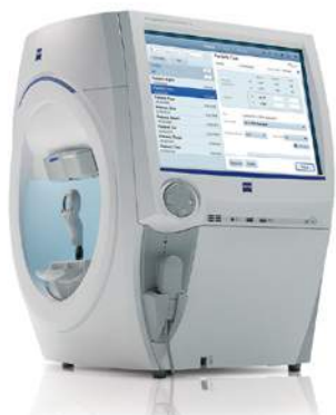
静的視野検査 Humphrey Field Analyzer3 (CARL ZEISS MEDITEC社製)

ハンフリーでは僅かな視野欠損を捉え、緑内障の局所的欠損と、中間透光体混濁による全体的感度低下を区別できます。病的な進行の有無を的確に判別し、信頼度の高い結果が得られます。病気が見つかった後は、進行や治療の効果を確認するため定期的な検査が必要です。