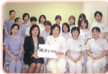
全員で眼力をつけるぞ!! 目配り・気配り・心配り