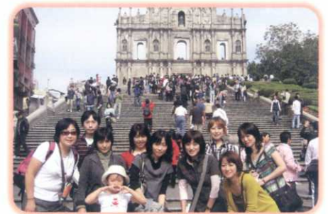
11月 マカオ 聖ポール天主堂跡にて