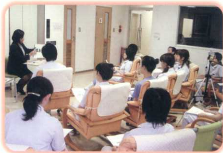
月2回、木曜午後は研修会を行っております。